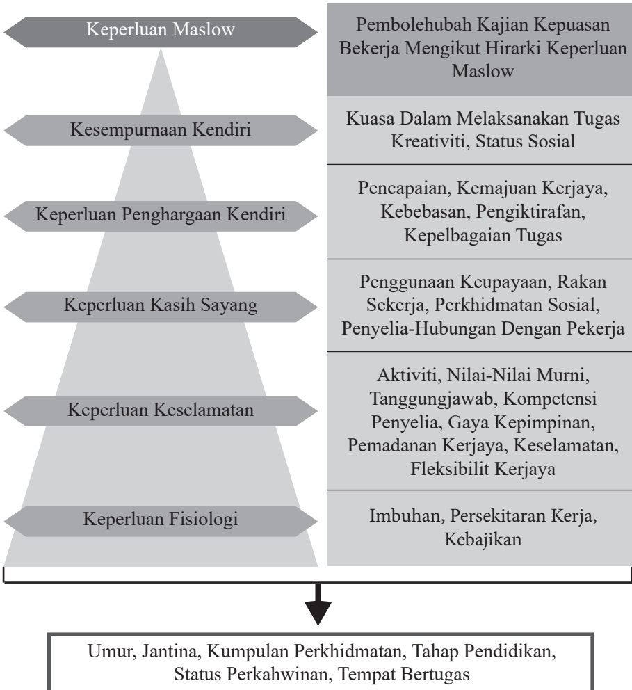
Rajah 2: Kerangka konseptual kajian kepuasan bekerja warga KPM

Kerangka konseptual kajian kepuasan bekerja adalah seperti berikut: