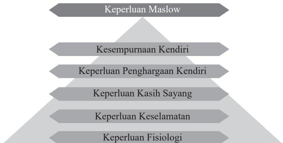
Rajah 1: Model Hierarki Keperluan Maslow Adaptasi dari Model Hierarki Keperluan Maslow (1968)

Di dalam Model Hierarki Keperluan Maslow menunjukkan manusia berusaha untuk memenuhi dahulu keperluan asas seperti makanan, pakaian dan tempat tinggal sebelum cuba memenuhi keperluan lebih tinggi seperti keselamatan, sosial, pencapaian dan pengiktirafan. Model ini menggambarkan pendekatan humanistik yang melihat manusia bersifat rasional dan sentiasa berinteraksi sama ada diri sendiri dan orang lain. Implikasi daripada sifat yang dimiliki inilah, mereka memperlihatkan tingkahlaku mengikut tuntutan naluri dalam bentuk tatatingkat keperluan diri seperti Rajah 1 di bawah.