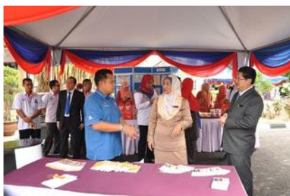
Program NBOS JPA 1Pesara @Zon Selatan