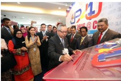
Majlis Perasmian JPA4U Week 2016 @C1