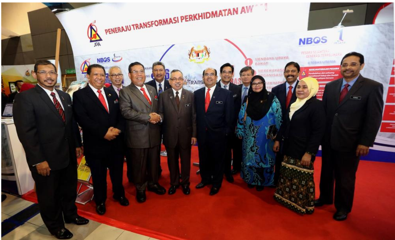
Majlis Persada Inovasi Perkhidmatan Awam 2016