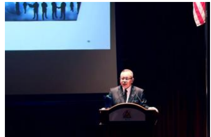
Perhimpunan Bulanan JPA Bagi Bulan November 2016