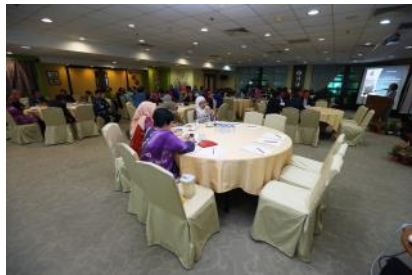
Mesyuarat Kerja Mengenai 'The Future Of Malaysian Public Service 2020 And Beyond'