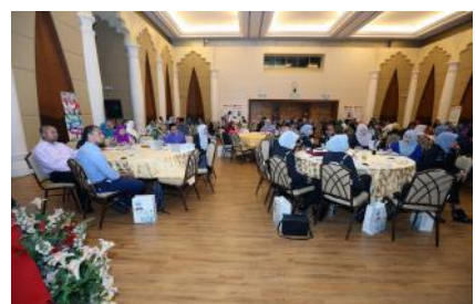
Seminar Perluasan Inisiatif 1Malaysia Customer Service Of Civil Servant (1SERVE)