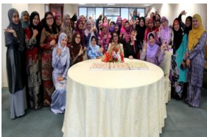
Program Health Fest , PUSPANITA JPA