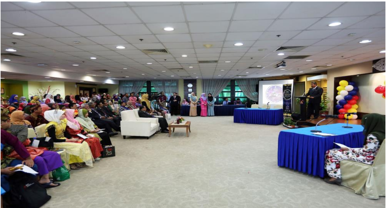
Program Bulan Bahasa Kebangsaan Peringkat JPA Tahun 2016