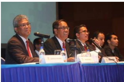
Mesuarat Agung Tahunan dan Majlis Apresiasi Kelab JPA Tahun 2016