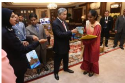
Majlis Penyampaian Biasiswa Yang di-Pertuan Agong Sesi 2016/2017