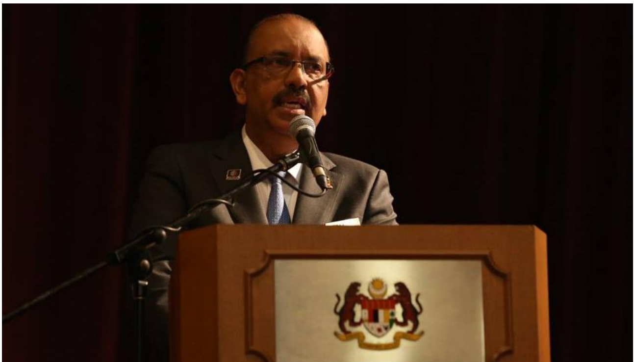
Sesi Bersama Media Susulan Laporan Ketua Audit Negara Tahun 2015