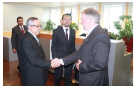
Lawatan Kerja KPPA ke United Kingdom, Russia, Republik Czech, Jerman dan Perancis